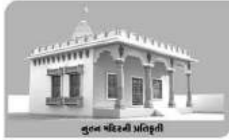
તુલન મંદિરની પ્રતિકૃતિ

★ શ્રી કચ્છ વાગડ ગામ લાકડીયા મુકામે શ્રી જજ્જબૌતેરા અને શ્રી વિશલમાતાના ભવ્ય મંદિરનું નવનિર્માણનું કાર્ય જોરશોરથી ચાલી રહ્યું છે.