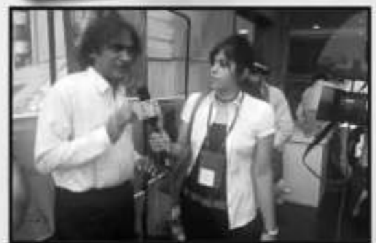
INTERVIEW ON TV CHANNEL AFTER RECEIVING AWARD